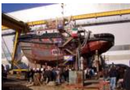
SINISTRA La costruzione di un rimorchiatore

«La sicurezza del porto, delle sue persone, delle navi che ormeggiano e disormeggiano tutti i giorni, è la nostra prima priorità; non ce ne sono e non ce ne saranno mai altre altrettanto importanti. Per cui abbiamo persone dedicate alla formazione, al training e nel nostro Dna c'è la parola sicurezza, delle persone prima di tutto e poi dei giganti del mare che vengono a trovarci nel nostro splendido Golfo che sta dimostrando di poter coniugare in maniera brillante porto, cantieristica e turismo».