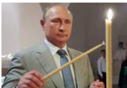
SINISTRA Il presidente russo Vladimir Putin