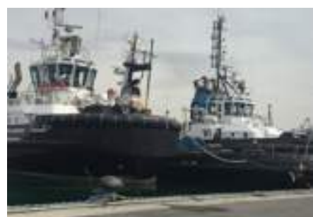
SINISTRA Rimorchiatori nel porto della Spezia