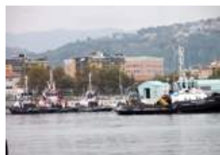
DESTRA Rimorchiatori presso la Calata Malaspina della Spezia