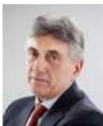
* DOCENTE E AVVOCATO, FOUNDING PARTNER STUDIO LEGALE ZUNARELLI