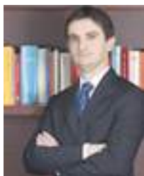
*Avvocato, Pavia e Ansaldo

Dalle videoriprese (per scopi ludici, amatoriali, professionali, di polizia, ecc...) al monitoraggio (ad esempio, nel campo agricolo, ma anche nel mondo industriale) fino addirittura al trasporto di cose ( come nella consegna dei beni acquistati ): i droni sono capaci di sovvertire le tecniche fino ad oggi utilizzate con un notevole risparmio di tempo, denaro e con una efficacia di risultato molto più elevata rispetto agli standard tradizionali.