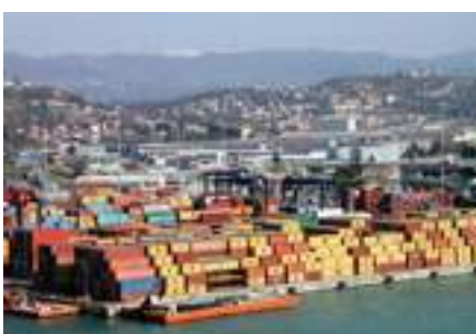
SINISTRA Il porto della Spezia