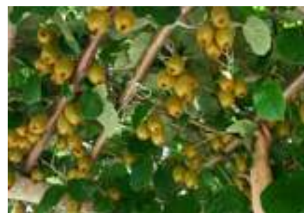
DESTRA Una coltivazione di kiwi