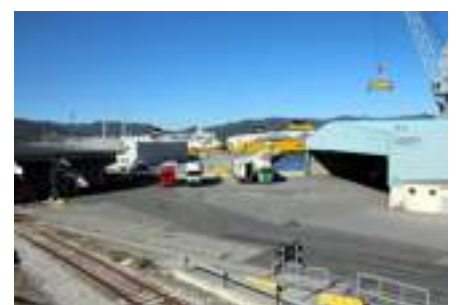
DESTRA Il Reefer Terminal nel bacino di Vado Ligure