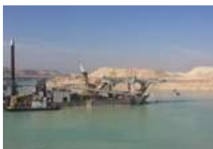
SINISTRA Lavori di dragaggio

Bisogna però vedere fino a quando queste misure tampone basteranno a calmare gli animi.