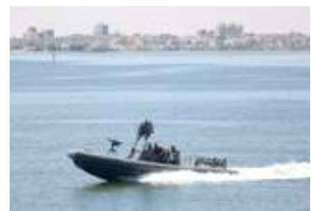
DESTRA Pattugliamento dell'infrastruttura