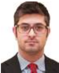
* Lca - Lega Colucci & Associati Law Firm

CON la liberalizzazione del mercato del lavoro introdotta dalla legge n. 196 del 197 e ora organicamente disciplinata dai D. Lgs. n. 26 del 2003 e n. 81 del 2015, gli operatori economici utilizzano ampiamente lo schema del contratto di somministrazione di lavoro, garantendo infatti tale forma contrattuale una apprezzabile flessibilità . Tale contratto viene infatti concluso tra un'agenzia di somministrazione autorizzata e un'impresa utilizzatrice in base al quale la prima mette a disposizione della seconda uno o più lavoratori suoi dipendenti i quali, per la durata necessaria, svolgono la propria attività nell'interesse e sotto la direzione e il controllo dell'utilizzatore .