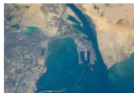
DESTRA L'imbocco meridionale del Canale