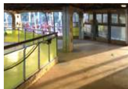
DESTRA Uno dei ponti interni