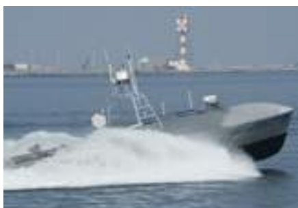
SINISTRA Nave-drone della Marina americana